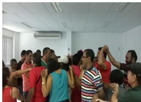
Figura 3: Capacitação dos membros do CODETER