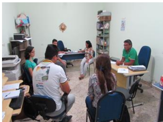
Figura 2: Reunião de planejamento com o núcleo diretivo CODETER e NEDET