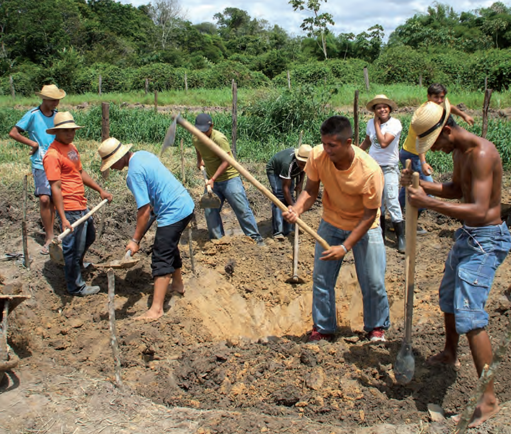
Construcción de huerta circular