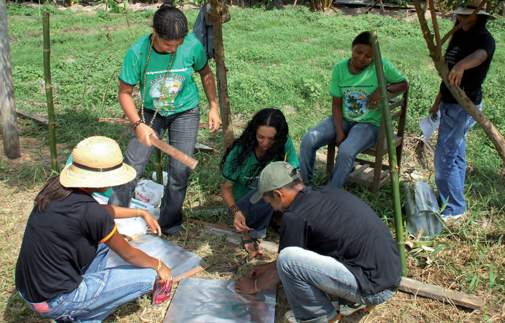
El trabajo como principio educativo