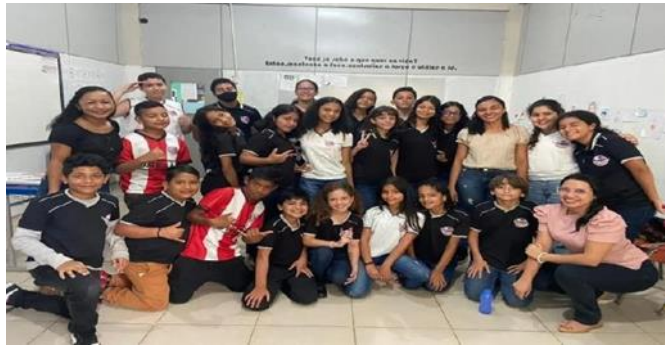
Figura 10: Colégio Conexão