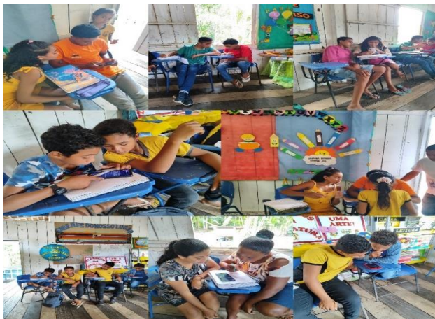
Figura 08: Escola Furo do Baixo