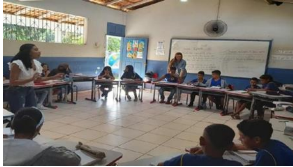
Figura 06: Escola Municipal Professor Simplício Ferreira de Souza