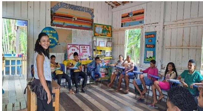
Figura 11: Escola ribeirinha Furo do Baixo