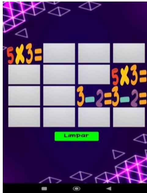
Figura 03 - Jogo de memória

O primeiro jogo, desafio inicial, são oitos pares de cartas contendo as quatro expressões numéricas. Cada jogador é desafiado a encontrar os pares correspondentes, promovendo desenvolvimento de agilidade e também tomada de decisões rápida. A Figura 03 mostra o jogo de memória.