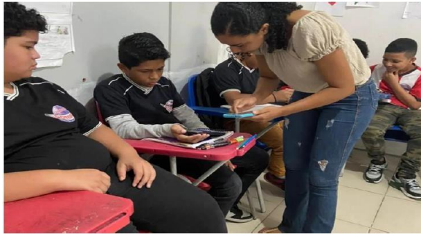
Figura 07: Colégio Conexão