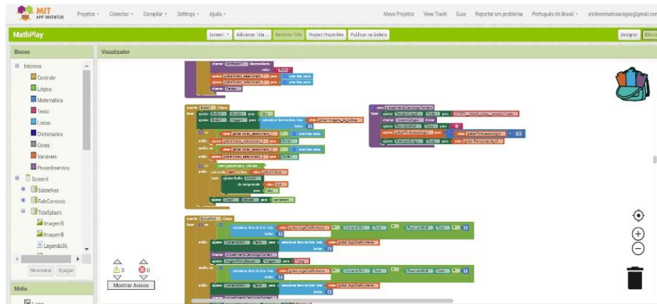
Figura 01 – Blocos de Programação

Durante o processo de desenvolvimento foram utilizados um total de 2.251 blocos de programação para implementar as diversas funcionalidades e recursos do aplicativo. A Figura 01 mostra uma parte desses blocos.