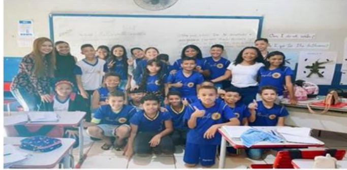
Figura 09: Escola Municipal Professor Simplicio Ferreira de Souza

competição saudável e estimulou o interesse dos estudantes pela disciplina, tornando o aprendizado da matemática mais participativo, como mostram as Figuras 09, 10 e 11.