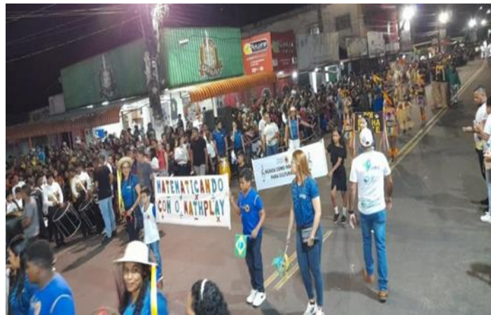
Figura 12: Desfile em Santa Izabel do Pará

Convém destacar que a Escola Simplício Ferreira de Souza também participou do evento ocorrido no dia 07 de setembro de 2023, em Santa Izabel do Pará, onde prestou uma homenagem especial ao aplicativo MathPlay . Durante o desfile, a escola destacou a importância dessa ferramenta no contexto educacional, reconhecendo seu papel no aprimoramento do ensino da matemática e no estímulo ao aprendizado interativo dos estudantes. A participação da escola no evento demonstrou o compromisso contínuo com a inserção de tecnologias educacionais e o reconhecimento dos benefícios que elas proporcionam ao processo de ensino e aprendizagem, como mostra a Figura 12.