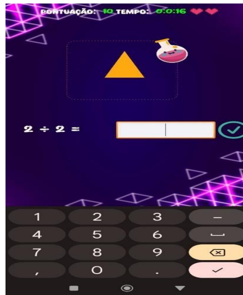
Figura 05 - Jogo Desafio dos Números